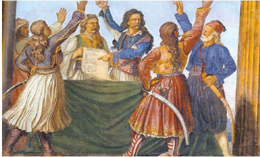
Ludwig Michael von Schwanthaler: "Η Εθνική Συνέλευση στην Επίδαυρο"

Προκειμένου να εδραιωθεί η Επανάσταση, εκτός από τις πολεμικές ενέργειες χρειαζόταν και μια πολιτική οργάνωση των επαναστατημένων περιοχών. Έτσι, από την αρχή δημιουργήθηκαν τρεις τοπικές «κυβερνήσεις»: η Πελοποννησιακή Γερουσία στην Πελοπόννησο, η Γερουσία στην Δυτική Στερεά και ο Άρειος Πάγος στην Ανατολική Στερεά Ελλάδα.